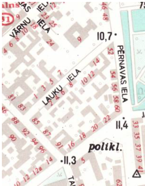
Lauku ielas situācijas plāns. 1995. gads.

Lauku arī Lauka (kr. Polevaja., vāc. Feldstrasse) ielas nosaukums piešķirts 1875. gadā, Lauku ielas nosaukums saistīts ar īpašu situāciju jo apbūvē sāka veidoties 1876. gadā tikai ielas nepāra numuru pusē, bet otrā pusē atrādās pilsētas ganību lauki, kurus sadalīja apbūves gabalos tikai 1897. gadā.