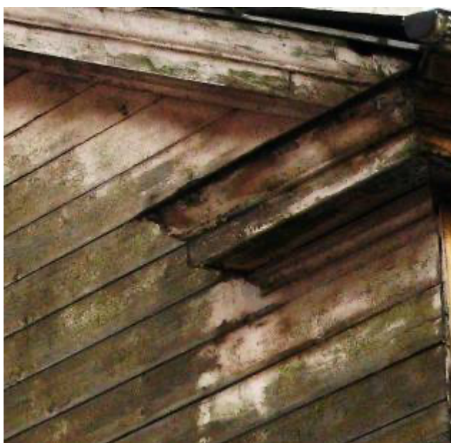
Ēka Lauku ielā Nr. 5, celta 1897.gadā, arhitekts Konstantīns Pēkšēns. Sienas oriģinālais dēļu apšuvums un dzega. 2012. gads.

Klasiskā stila koka fasādes zaudējusi savu primāro dēļu apšuvumu un pārvērtās par elementāro koka kasti, ja nebūtu saglabājušas daži arhitektoniskie elementi kā frontona un sānu plāto dēļu apšuvums, dzega un cokola stāva velvītie logi ar balstu akmeņu konfigurāciju centrā, kas saglāba ēkas kopējo arhitektonisko masu.