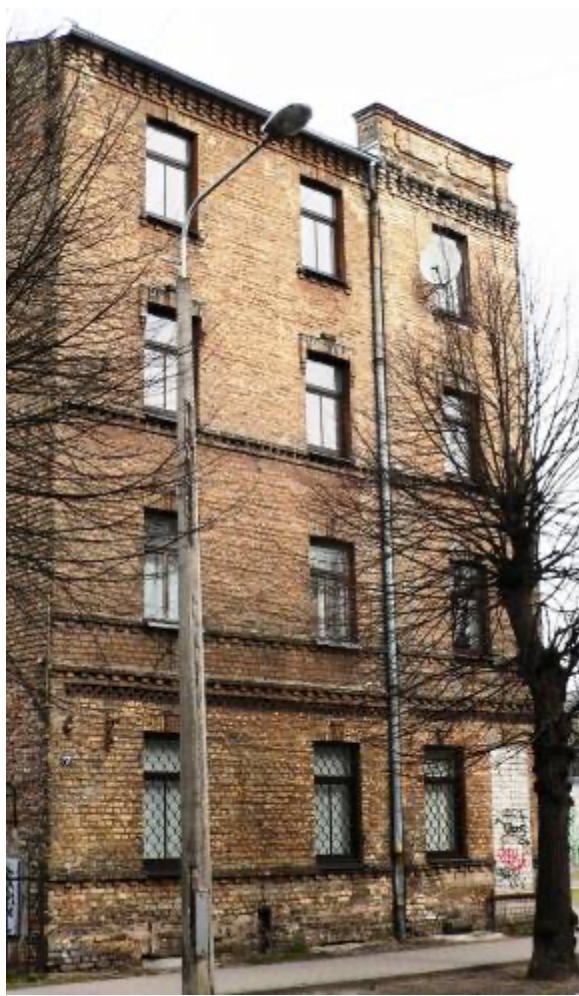
Ēka Lauku ielā Nr. 7, celta 1897.gadā, arhitekts Konstantīns Pēkšēns.2012. gads.

Lauku ielā Nr. 7, Gr. 36/82, četru stāvu mūra īres un tirdzniecības namu uzcelta pēc arhitekta Konstantīna Pēkšēna 1897. gada 30. maijā apstiprināta projekta. Būve pabeigta 1898. gadā 31. martā. Namu cēlis Slokas sīkpilsonis un būvgaldnieks, vēlāk smagais ormanis Valts Vittenbergs, namīpašums Vittenbergu ģimenes īpašuma atrādās no 1882. gadā līdz nacionalizācijai 1940. gadā.