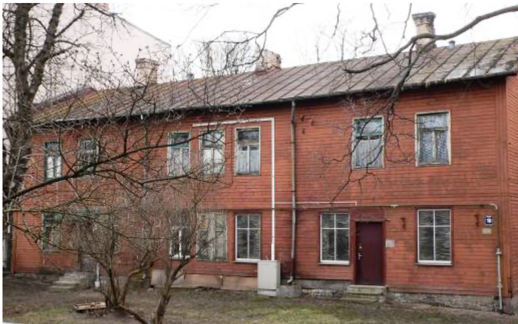
Ēka Lauku ielā Nr. 10, celta 1898.gadā, arhitekts Alfrēds Ašenkampfs. 2012. gads.

Lauku ielā Nr. 10, Gr. 36/97, divu stāvu koka īres namu cēlis Bīriņu pagasta zemnieks Augusts Baltābols pēc arhitekta Alfrēda Ašenkampa 1898. gada 17. martā apstiprināta projekta, būve pabeigta 1898. gada 10. decembrī. Strādnieku vien istabu kazarmas tipa ēka ar galerijas neapsildāmo koridoru un tualetēm trepju telpā.