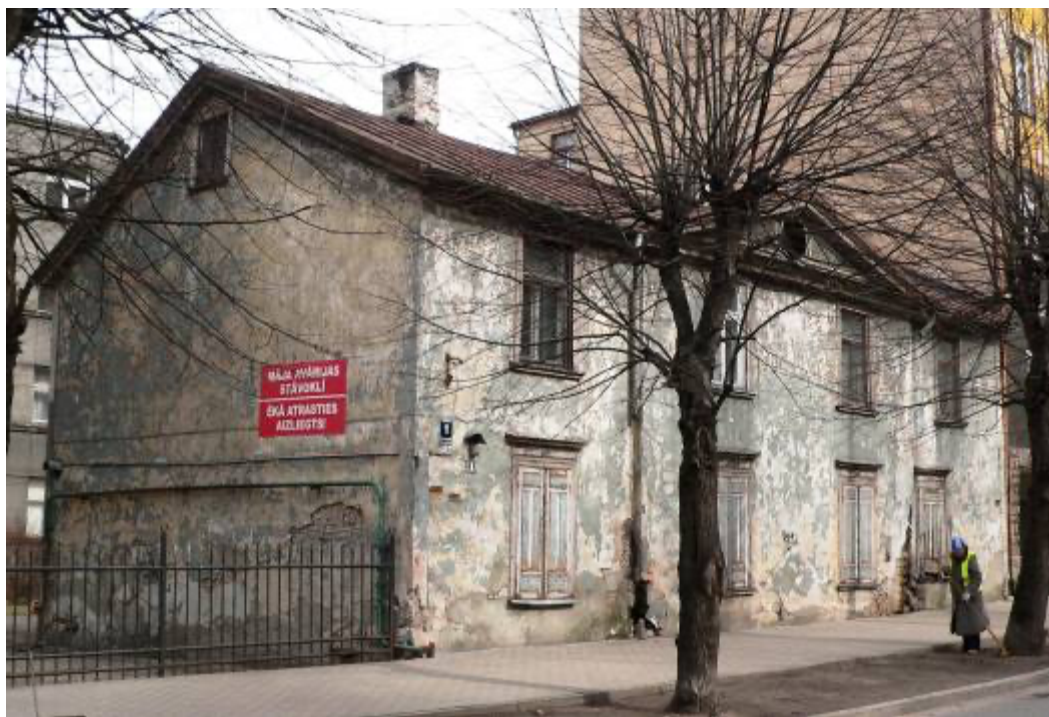
Ēka Lauku ielā Nr. 1, celta 1897.gadā, tehniķis Heinrihs Devendruss. 2012. gads.