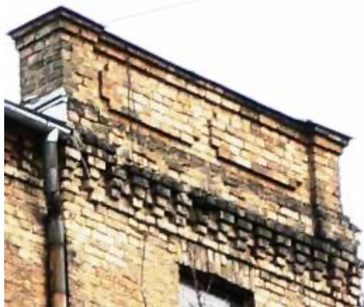
Ēka Lauku ielā Nr. 7, celta 1897.gadā, arhitekts Konstantīns Pēķšēns. Frontons. 2012. gads.

Ziņojums laikraksta „Jaunākās Ziņas”. 1921. gads.