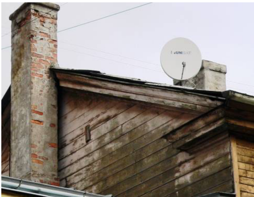
Ēka Lauku ielā Nr. 5, celta 1897.gadā, arhitekts Konstantīns Pēkšēns. Sienas oriģinālais dēļu apšuvums un dzega. 2012. gads.

Klasiskā stila koka fasādes zaudējusi savu primāro dēļu apšuvumu un pārvērtās par elementāro koka kasti, ja nebūtu saglabājušas daži arhitektoniskie elementi kā frontona un sānu plāto dēļu apšuvums, dzega un cokola stāva velvītie logi ar balstu akmeņu konfigurāciju centrā, kas saglāba ēkas kopējo arhitektonisko masu.