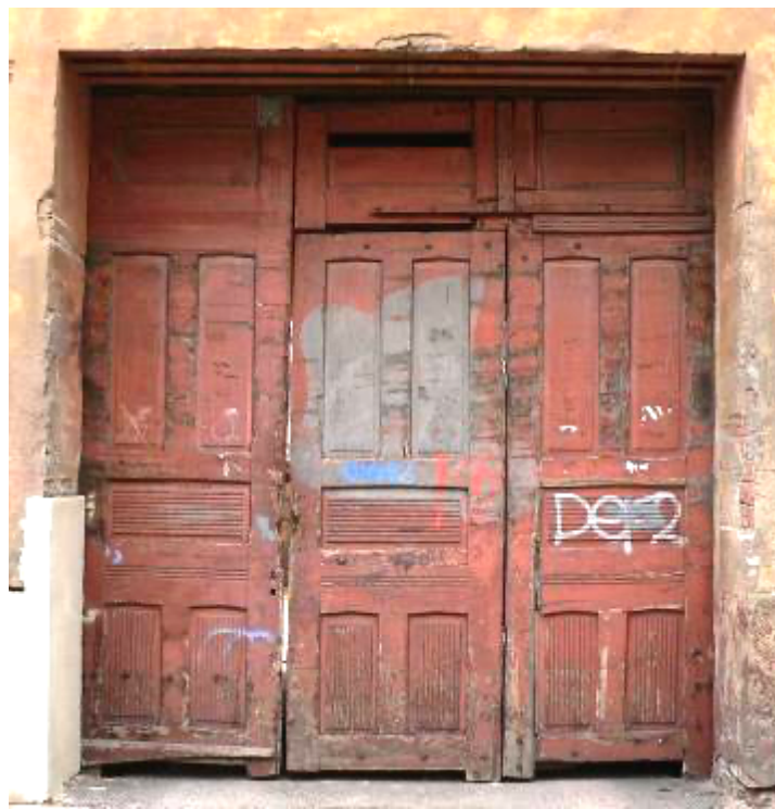
Ēka Lauku ielā Nr. 6, celta 1911.gadā, arhitektsEižens Pole. Caurbrauktuves mezgla vārti. 2012. gads.