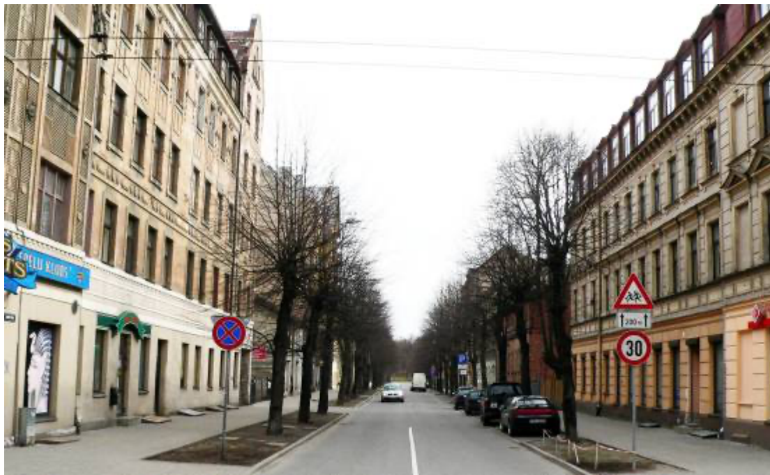
Lauku ielas skats no Tallinas ielas pusēs. 2012. gads.

attīstīs pakāpeniski, nomainot viena laikmeta būves pret citām būvēm, pēc arhitektūras attīstības un modes pieprasījumā.