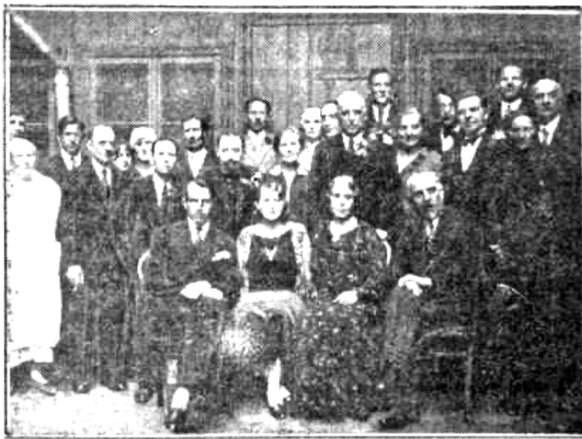
Firmas „Augusts Ritterbergs” piecdesmit gadu pastāvēšanas jubileja. 1931. gads.