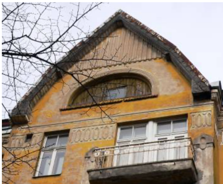
Ēka Lauku ielā Nr. 3, celta 1911.gadā, arhitekts Aleksandrs Vanags. Erkers noslēdzas ar tautisko romantisko zelmeni. 2012. gads.

dekoratīvo rāmi. Erkeri divi balkoni, trešā un ceturta stāvā, kas nobīdīti uz vienu pusi ar savienoto logu un izejas durvju apdari, ceturta stāva balkons papildināts ar diviem dekoratīviem cilņiem, pilastru veida, kas attēlo shematiski skandināvu vīriešu saktas.