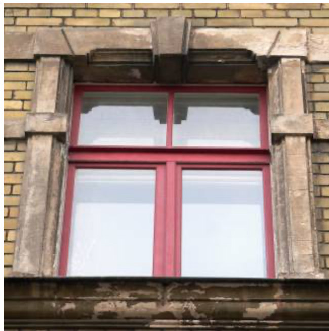
Ēka Lauku ielā Nr. 4, celta 1898.gadā, arhitektsAlfrēds Ašenkampfs. Trešā stāva logu ailes dekoratīvais noformējums. 2012. gads.

Trešā stāva logu ailes apmetuma veidotiem dekoratīvām, filigrāni izpildītām, apmalēm, augšēja daļa ar atslēga akmeņi centrā un kā otrā stāva visu logu ailu vienojošam divām horizontālām apmetuma joslām ķieģeļu fasādē