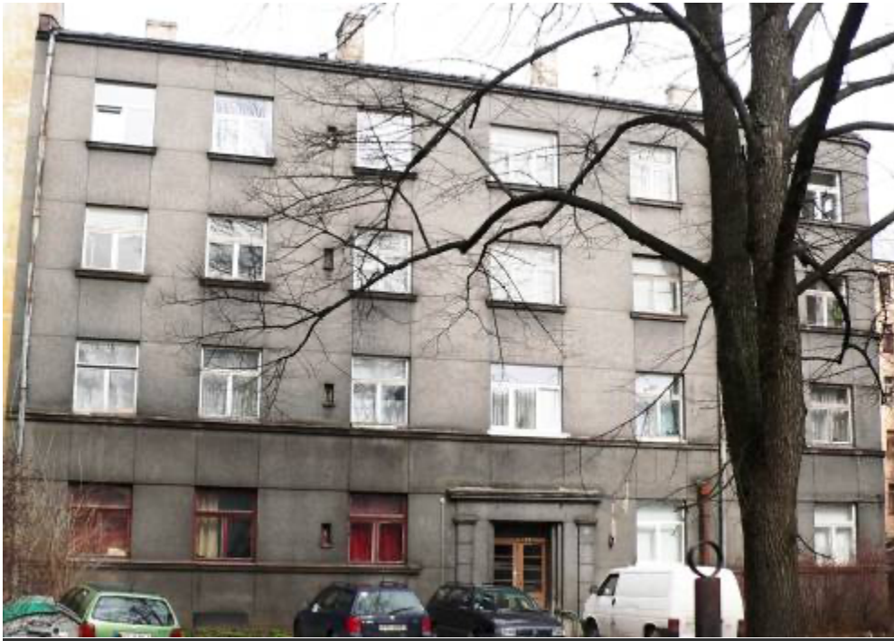
Ēka Lauku ielā Nr. 1, celta 1937.gadā, arhitekts Arnolds Jākobsons. 2012. gads.