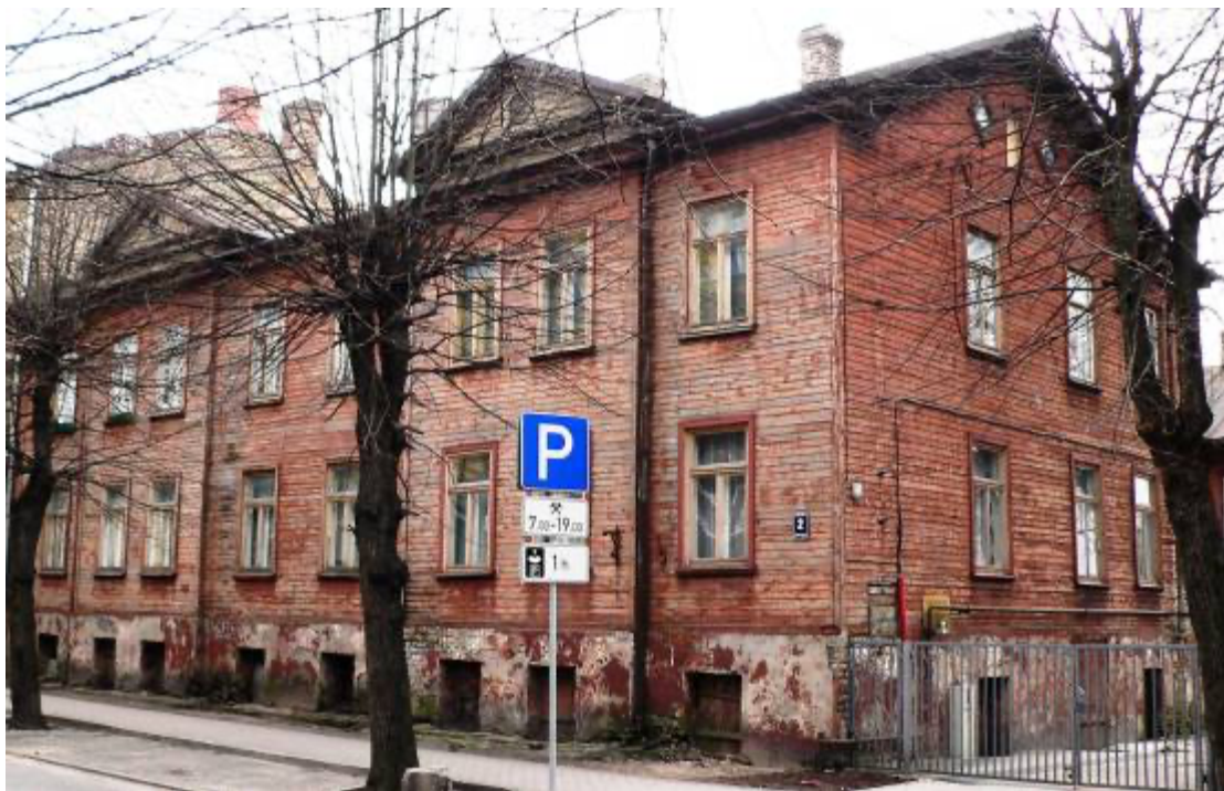
Ēka Lauku ielā Nr. 2, celta 1898.gadā, tehniķis Indriķis Devendruss. 2012. gads.

Lauku ielā Nr. 2, Gr. 36/92, divu stāvu koka ģībs un tirdzniecības nams ar mūra puspagrabu celts pēc tehniķa Indriķa (Hainriha) Devendrusa 1898. gada 10. aprīlī apstiprināta projekta. Būve pabeigta 1898. gada 27. oktobrī. Klasiskā fasāde laiku gaitā