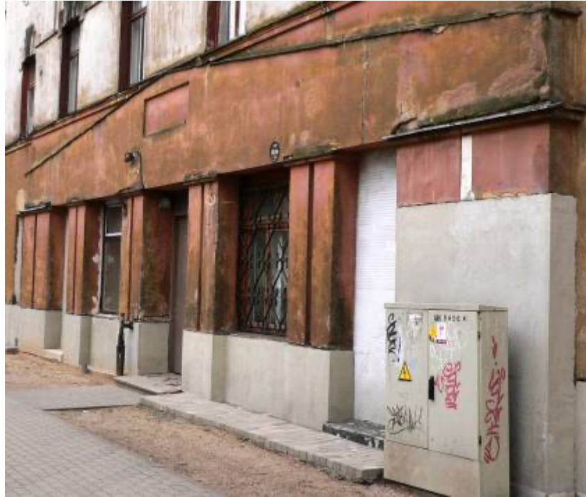
Ēka Lauku ielā Nr. 6, celta 1911.gadā, arhitektsEižens Pole. Portāls. 2012. gads.

to iznīcināšanas 1980 – tajos gados. Vārti trīsdalīgi, centrā ieejas daļa kājniekiem un divas veramas daļas iebraukšanai, ar dekoratīviem pildīņiem augšēja daļa gludi, bet apakša, vizuālām līdzsvaram, horizontāli un vertikāli rievoti.