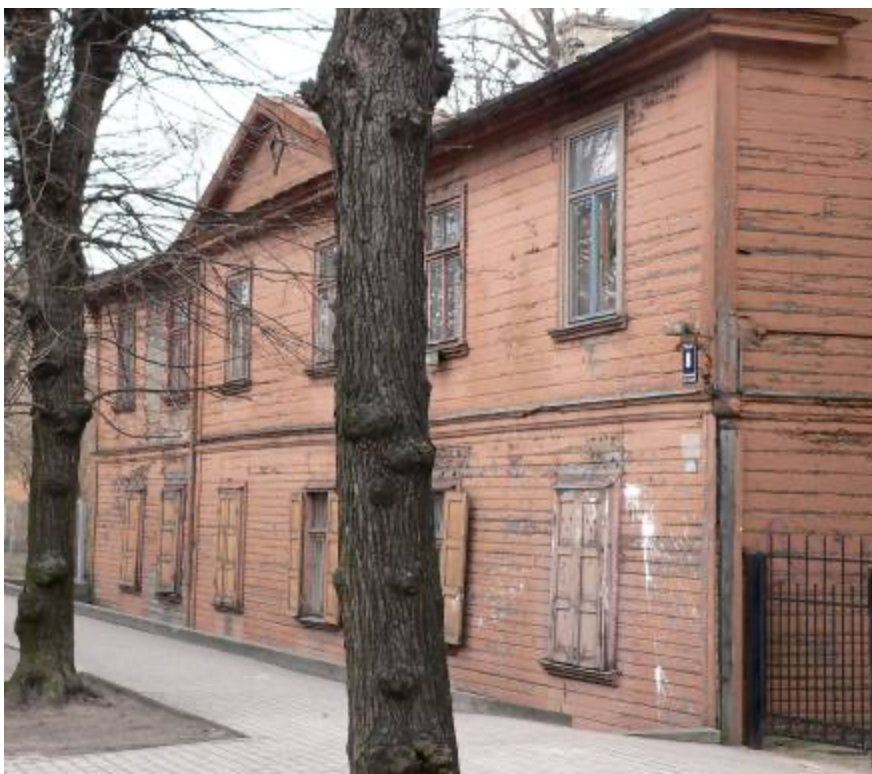
Ēka Lauku ielā Nr. 8, celta 1897.gadā, arhitekts Konstantīns Pēkšēns. 2012. gads.

Lauku ielā Nr. 8, Gr. 36/96, divu stāvu koka īres namu cēlis Puzes pagasta zemnieks Matīss Fridrihs Cveikuls pēc arhitekta Konstantīna Pēkšēna 1897. gada 27. maijā apstiprināta projekta, būve pabeigta 1897. gada 5. septembrī. Strādnieku vien istabu kazarmas tipa ēka ar galerijas neapsildāmo koridoru un tualetēm trepju telpā.