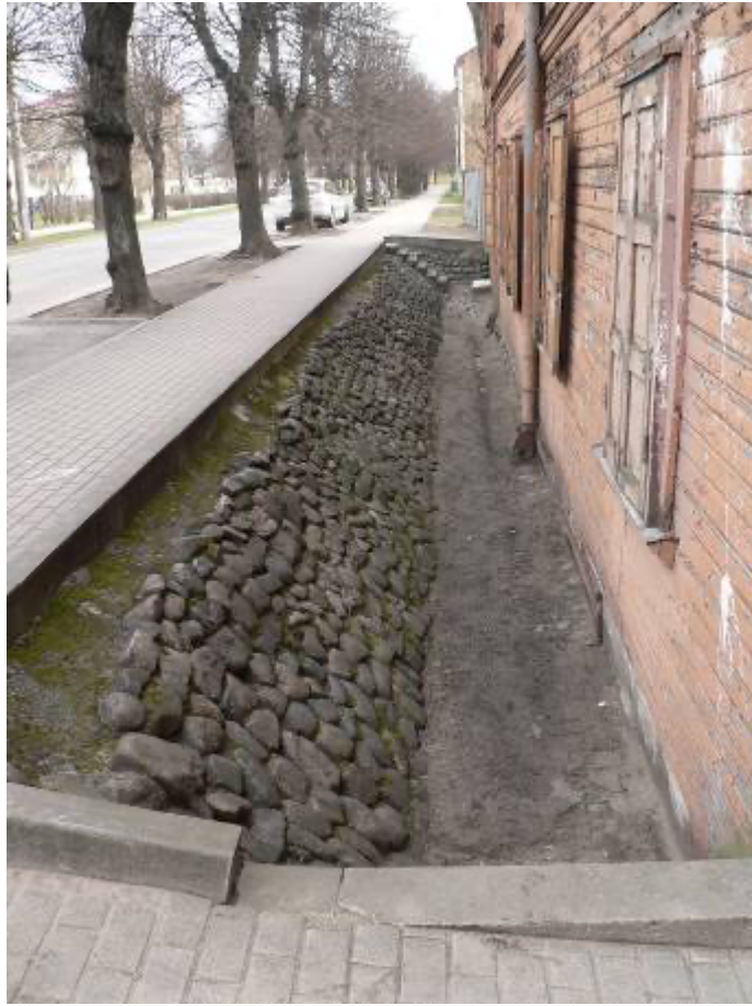
Aizsarggrāvis pie ēkas Lauku ielā Nr.8, Ielas iedzīvotāju ilgstošas cīņas liecinieks ar Rīgas valdi. 2012. gads.

Situācija izveidojusies 1908. gadā, kad Rīgas pilsētas valde realizēja regulēšanas darbus Lauku ielā, kuras pāru numura puse atrādās daudz zemākā vietā par pretējo pusi un paceļot ielas līmeni par piecām pēdām, ēku pirmais stāvs pārvērtās par puspagrabiem, kas pasliktināja nama vērtību. Ielas iedzīvotāji, kopā sešpadsmit grunts īpašnieki, iesniedza protestu Rīgas pilsētai valdei un miertiesai pieprasot par katru namīpašumu 5000, - rubļu kompensāciju namu aizsardzības grāvju izveidošanas darbiem. Tiesas process gāja piecus gadus, kad beidzot Rīgas valde nolēma, jo palielinājās tiesas procesa izmaksas, atpirkties no iedzīvotājiem samaksājot kompensāciju 50 % no pieprasītas summas, kas tika arī realizēts 1912. gadā.