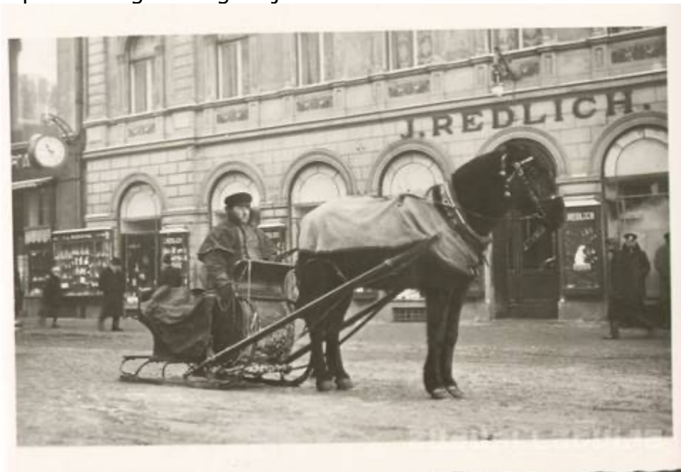
Rīgas ormanis. 1925. gads.