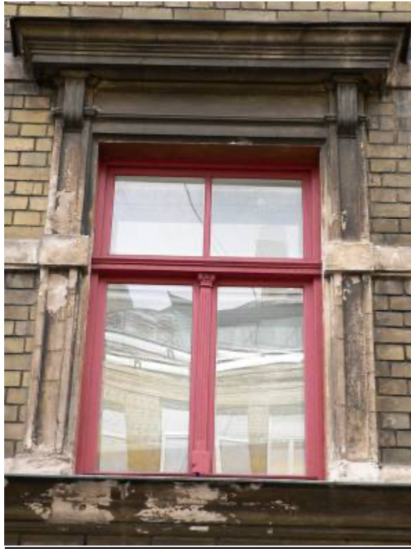
Ēka Lauku ielā Nr. 4, celta 1898.gadā, arhitektsAlfrēds Ašenkampfs. Otrā stāva logu ailes dekoratīvais noformējums ar vienkāršo sandriķi. 2012. gads.

Trešā stāva logu ailes apmetuma veidotiem dekoratīvām, filigrāni izpildītām, apmalēm, augšēja daļa ar atslēga akmeņi centrā un kā otrā stāva visu logu ailu vienojošam divām horizontālām apmetuma joslām ķieģeļu fasādē