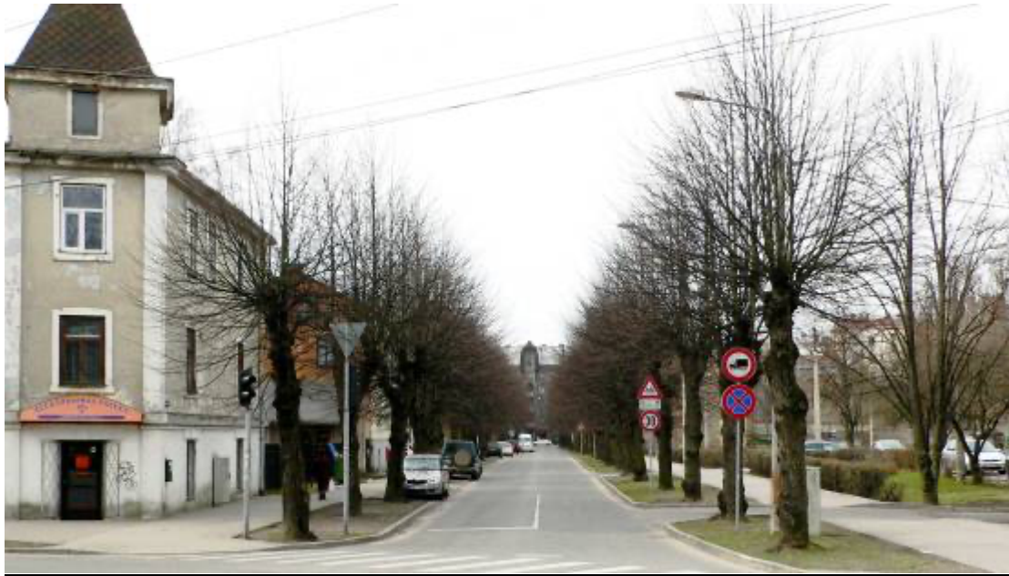
Lauku ielas skats no Pērnavas ielas pusēs. 2012. gads.

Pirmās ēkas bija koka viestāvu pārsvara amatnieku nelielas dzīvojamās mājas ar šķūņiem un stalliem, neviena ēka no sākotnējā perioda nav saglabājusies. Vecākās koka ēkas saglabājušas no otrā celtniecības perioda 1897/1898. gados, līdz ar to visas šīs ēkas celtas apmērām vienotā stilā, pie tam pāru numuru puse sākuma apbūvēs perioda ēkas celtas ar padziļinājumu zemes gabalos, veidojot vienoto ēku rindu, tādi vēl pastāv šodien Lauku ielā Nr. 2, Nr. 10 un Nr. 12, līdzīgas ēkas nojauktas Lauku ielā Nr. 4 un Nr. 6. visi būvēti pēc arhitekta Alfrēda Ašenkampfa projekta. Koku ēku fasādes apšuvums šodien pilnīgi nav saglabājies nevienai ēkai, izņemot dažus, tā Lauku ielā Nr. 1 redzamas logu ailu apdares detaļas un frontons, Lauku ielā Nr. 2 un Nr. 3. redzami frontoni un sānu sienu apšuvums, labāka situācija ēka Lauku ielā Nr. 8, kurai saglabājies liels procents no primāras fasādes apdares.