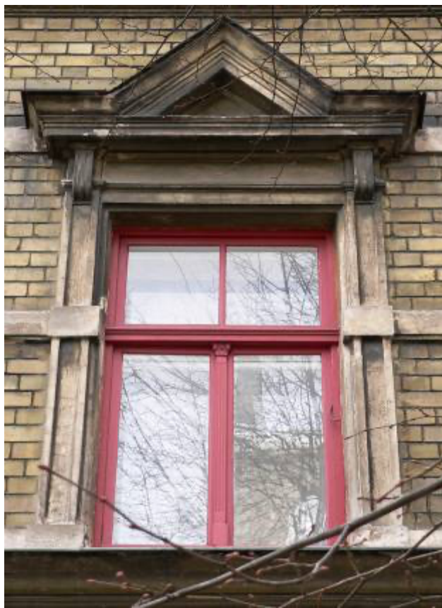
Ēka Lauku ielā Nr. 4, celta 1898.gadā, arhitektsAlfrēds Ašenkampfs. Otrā stāva logu ailes dekoratīvais noformējums ar trīs stūra sandriķi. 2012. gads.