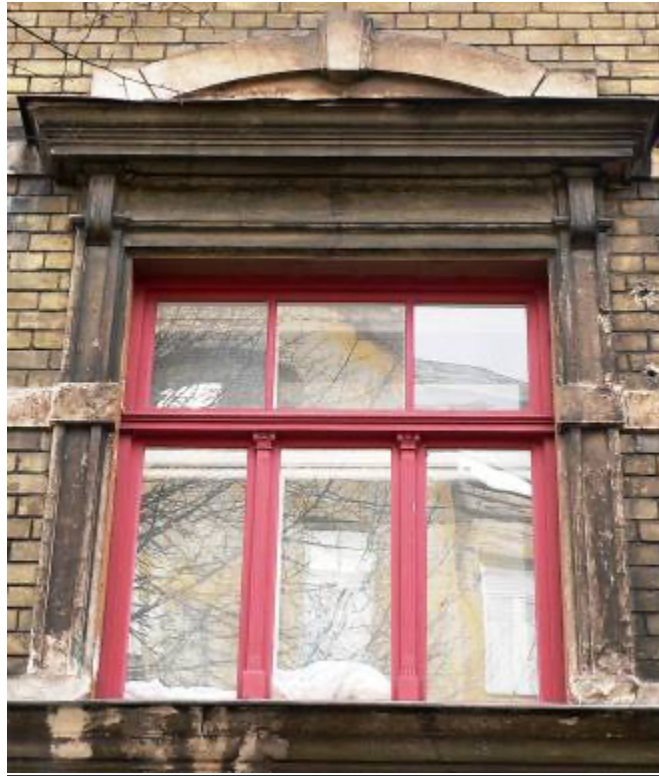
Ēka Lauku ielā Nr. 4, celta 1898.gadā, arhitektsAlfrēds Ašenkampfs. Otrā stāva logu ailes virs vārtiem dekoratīvais noformējums. 2012. gads.