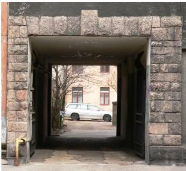
Ēka Lauku ielā Nr. 3, celta 1911.gadā, arhitekts Aleksandrs Vanags. Ar dabisko granīta akmeņi apliktais iebrucamo vārtu mezgls. 2012. gads.