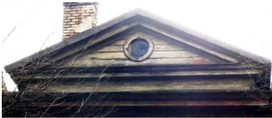
Ēka Lauku ielā Nr. 2, celta 1897.gadā,tehniķis Indriķis devendruss. Frontons. 2012. gads.

zaudējusi savu oriģinālo dēļu apdari un apšuvumu, padomju laika pārprastas siltināšanas akcijas, bet saglabājušas daži arhitektoniskie elementi kā frontonu plāto dēļu apšuvums un tas dzegas un bēniņu logu aiļu apmales.