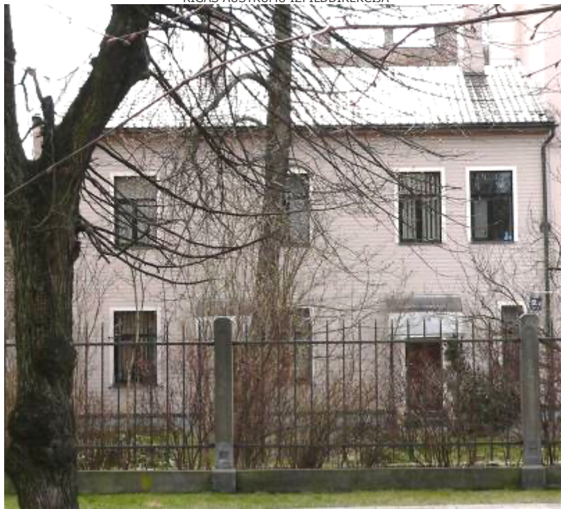
Ēka Lauku ielā Nr. 12, celta 1898.gadā, arhitekts Alfrēds Ašenkampfs. 2012. gads.