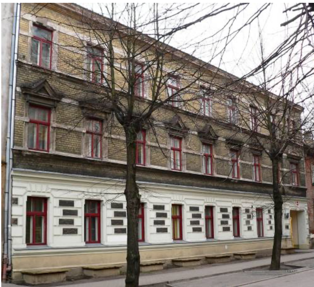
Ēka Lauku ielā Nr. 4, celta 1898.gadā, arhitektsAlfrēds Ašenkampfs. 2012. gads.

Lauku ielā Nr. 4, Gr. 36/80, trīs stāvu mūra īres namu stingra klasicisma stila būvēja Vilzēnu pagasta zemnieks un galdnieka