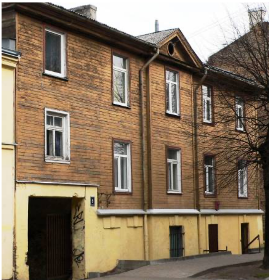
Ēka Lauku ielā Nr. 5, celta 1897.gadā, arhitekts Konstantīns Pēkšēns. 2012. gads.

Lauku ielā Nr. 5, Gr. 36/81, divu stāvu, faktiski trīs stāvu, koka īres nams celts pēc arhitekta Konstantīna Pēkšēna 1897. gada 28. martā apstiprināta projekta. Būve pabeigta 1897. gada 2. septembrī. Ēka balstās it kā uz mūra puspagraba stāvu, jo tā laika noteikumi liedza būvēt trīs stāvu koka ēkas un namīpašnieki spiesti būvēt mūra cokola stāvus, bet puspagrabs izveidojas sakarā ar ielas līmeņa regulēšanu 1907. gadā. Ēka divpadsmit vien istabu dzīvokļi strādniekiem, galerijas tipa ieejas mezgls un ar ērtībām trepju mūra telpā.