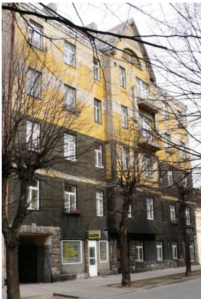
Ēka Lauku ielā Nr. 3, celta 1911.gadā, arhitekts Aleksandrs Vanags. 2012. gads.

Lauku ielā Nr. 3, Gr. 36/80, piecu stāvu mūra īres un tirdzniecības nams uzcelts pēc arhitekta Aleksandra Vanaga 1911. gada 19. aprīlī apstiprināta projekta. Būve pabeigta 1912. gada 28. jūnijā. Nacionālā romantisma stila fasāde sadalīta divas horizontālas daļas ar rupjo tumšo un gludo gaišo apmetumu. Pirmais partera vai cokola stāvs pasvītrots ar smago granīta apdari, kas raksturīga Somijas arhitektūrai ar dabiska granīta akmeņi apliktas iebraucamo vārtu un ieejas mezgli, rustoti mājas stūri un daļēji apakšēja nama josla. Otro un trešo stāvu atdala gaiša dzega. Ceturtā un piektā stāva līmeņi ģeometriski raksti, vairāk attiecināmi pie skandināvu motīviem.