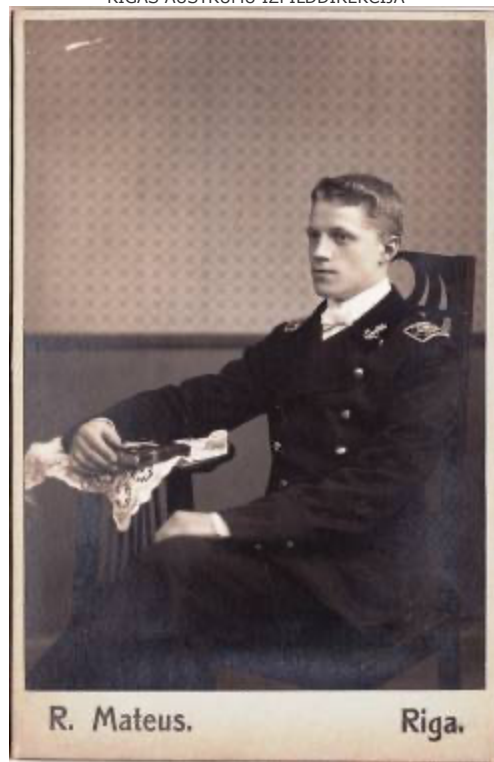
Krišjāņa Valdemāra Jūrskolas audzēknis, bijušais „Grīziņkalna puika”. Uzņemts Roberta Mateusa foto iestāde, Lauku ielā Nr. 11. 1910. gads.