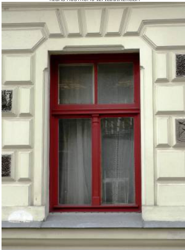
Ēka Lauku ielā Nr. 4, celta 1898.gadā, arhitektsAlfrēds Ašenkampfs. Pirmā stāva logu aiju dekoratīvais noformējums. 2012. gads.