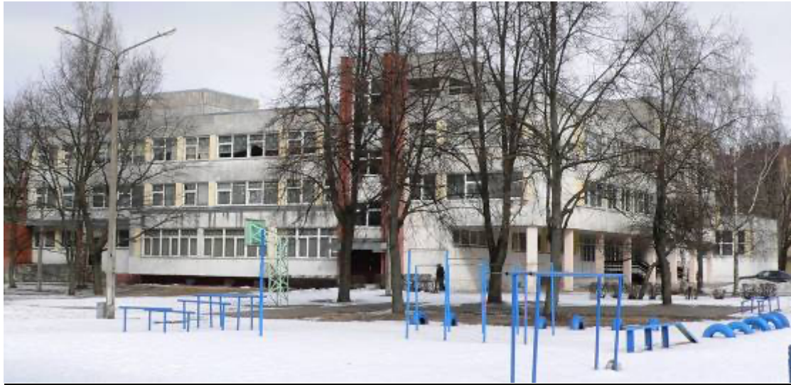
Rīgas krievu vidusskola, celta 1980. gadā. 2013. gads.