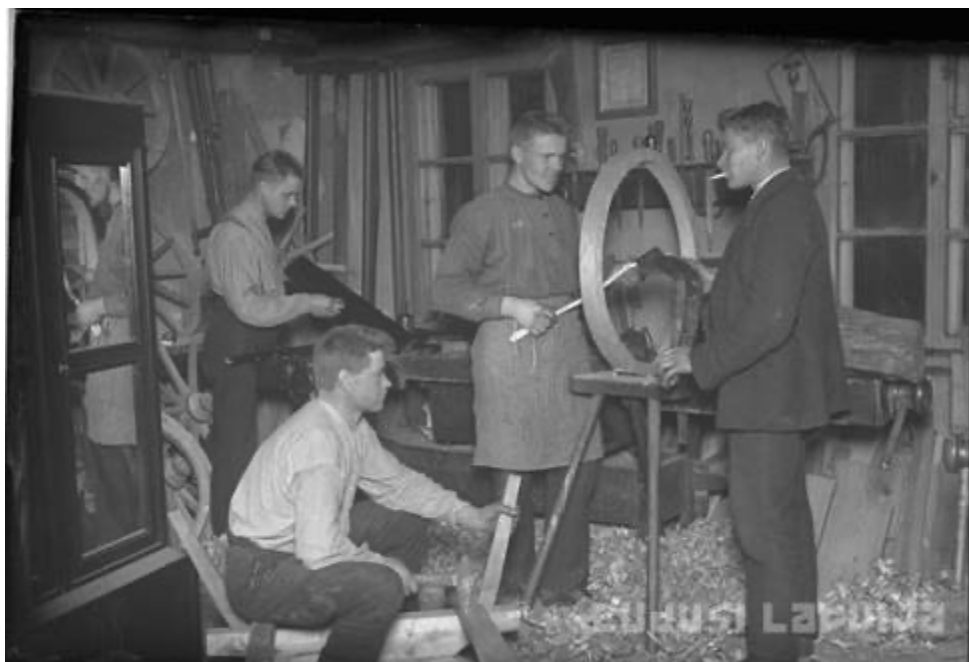
Ratnieku darbnīca. 1927. gads.