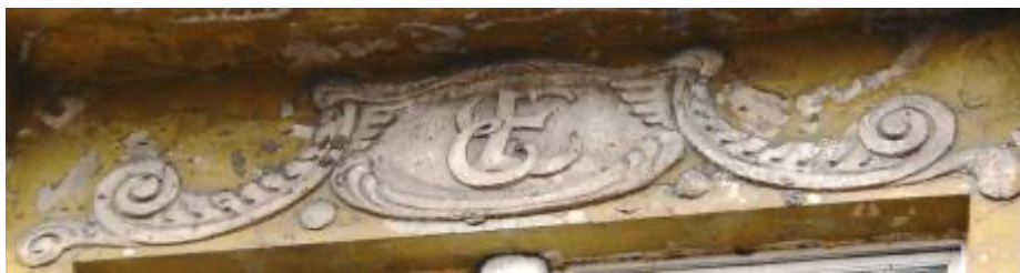
Ēka Lauku ielā Nr. 3, celta 1911.gadā, arhitekts Aleksandrs Vanags. Kartuža ar namīpašnieka monogrammu. 2012. gads.

Pagalmā 1911. gadā izbūvēts otrais piecu stāvu mūra ēkas korpuss, finansēšanas līdzdalību ņem arī Vilis Olavs ar 50 000 rubļu aizdevumu.