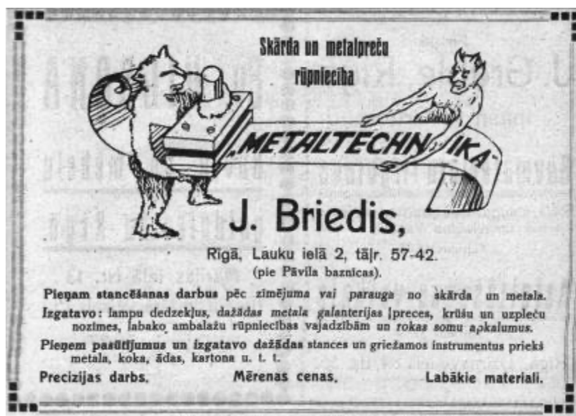
Metāla izstrādājumu uzņēmuma Lauku ielā Nr. 2 reklāma. 1925. gads.