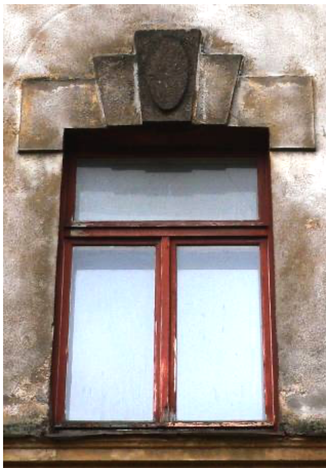
Ēka Lauku ielā Nr. 6, celta 1911.gadā, arhitektsEižens Pole. Otrā stāva logu ailes dekors. 2012. gads.

Šī ēka ir vienīgā tāda arhitektūras risinājuma būve Rīgā, unikālā ar to ka fasāde kopuma atspoguļo arhitektūras stilu attīstības evolūcijas ceļu no Ēģiptes stila, ieejas mezgla portāls, caur grieķu, fasādes augšējo stāvu pilastrī, līdz agrīnām klasicismam, frontons un logu ailu dekors.