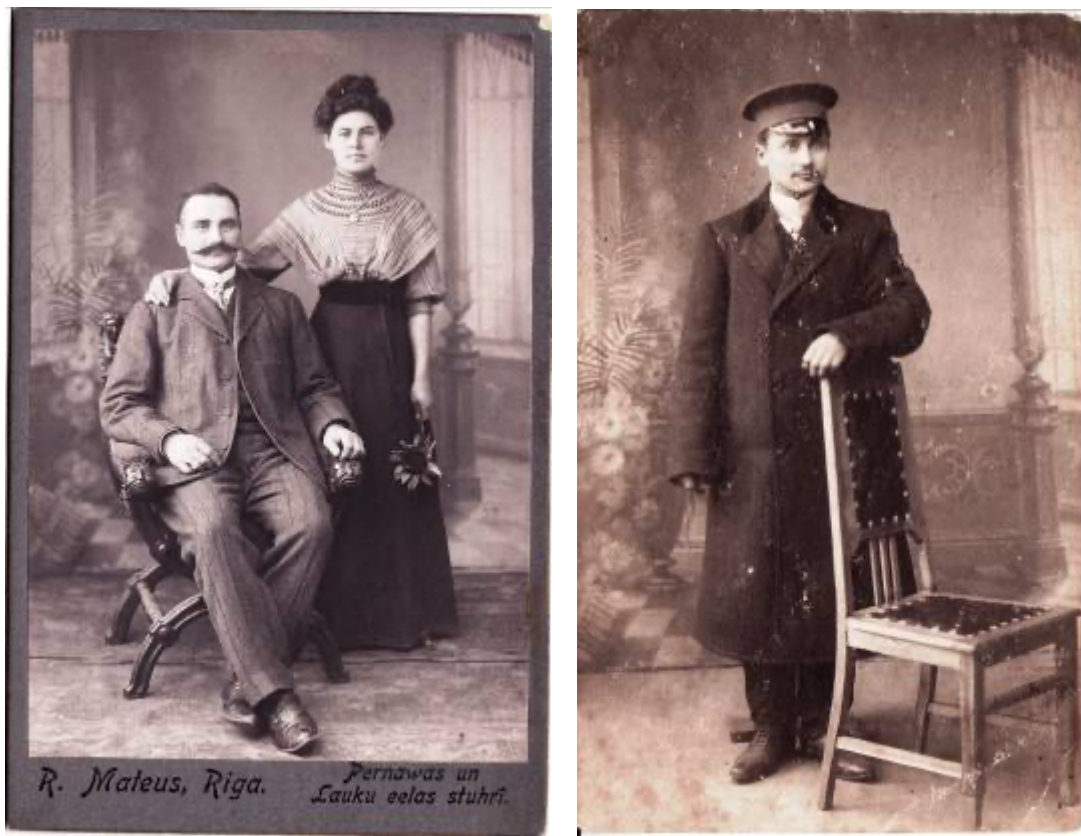
Grīziņkalna iedzīvotāji. Uzņemts Roberta Mateusa foto iestādē, Lauku ielā Nr. 11. 1907. gads.